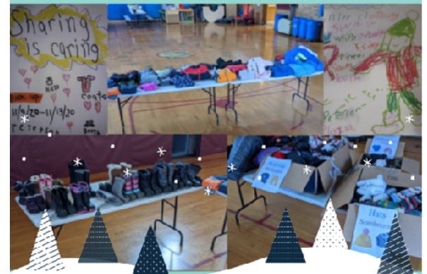
An amazing act of kindness from the Peterson community!